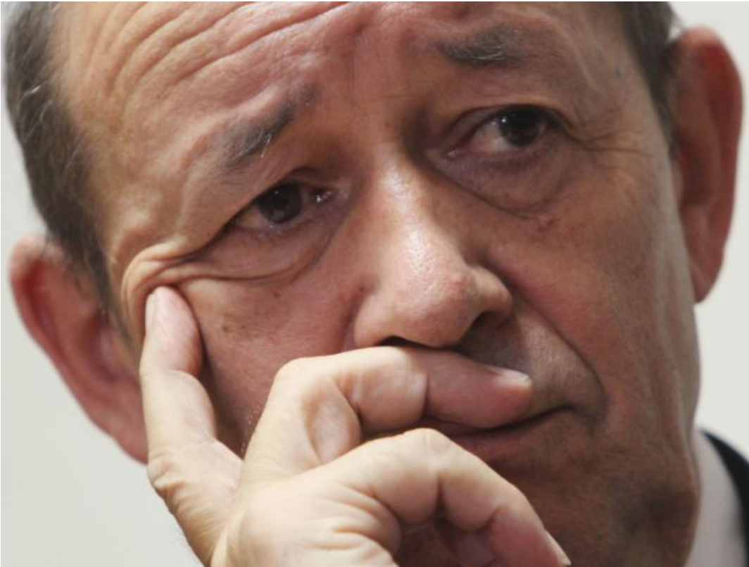
Ο Γάλλος υπουργός Εθ. Αμύνης Jean Le Drian

Η πρόσφατη είδηση της αποτυχημένης προσπάθειας που πραγματοποίησαν οι Γαλλικές ειδικές ένοπλες δυνάμεις, μας γύρισαν σχεδόν είκοσι χρόνια πίσω.