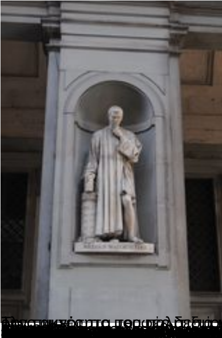
Από το νότιο περσικό δρόμο και στην πλατεία ντιοτσί. Μετά από μια μισή βραδιά κρύου ανέμου με