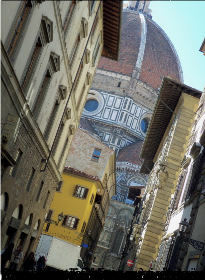
το πρωί με φως που είναι πολύ διαφορετικό από το μεσημέρι. Η πόλη είναι πολύ όμορφη,