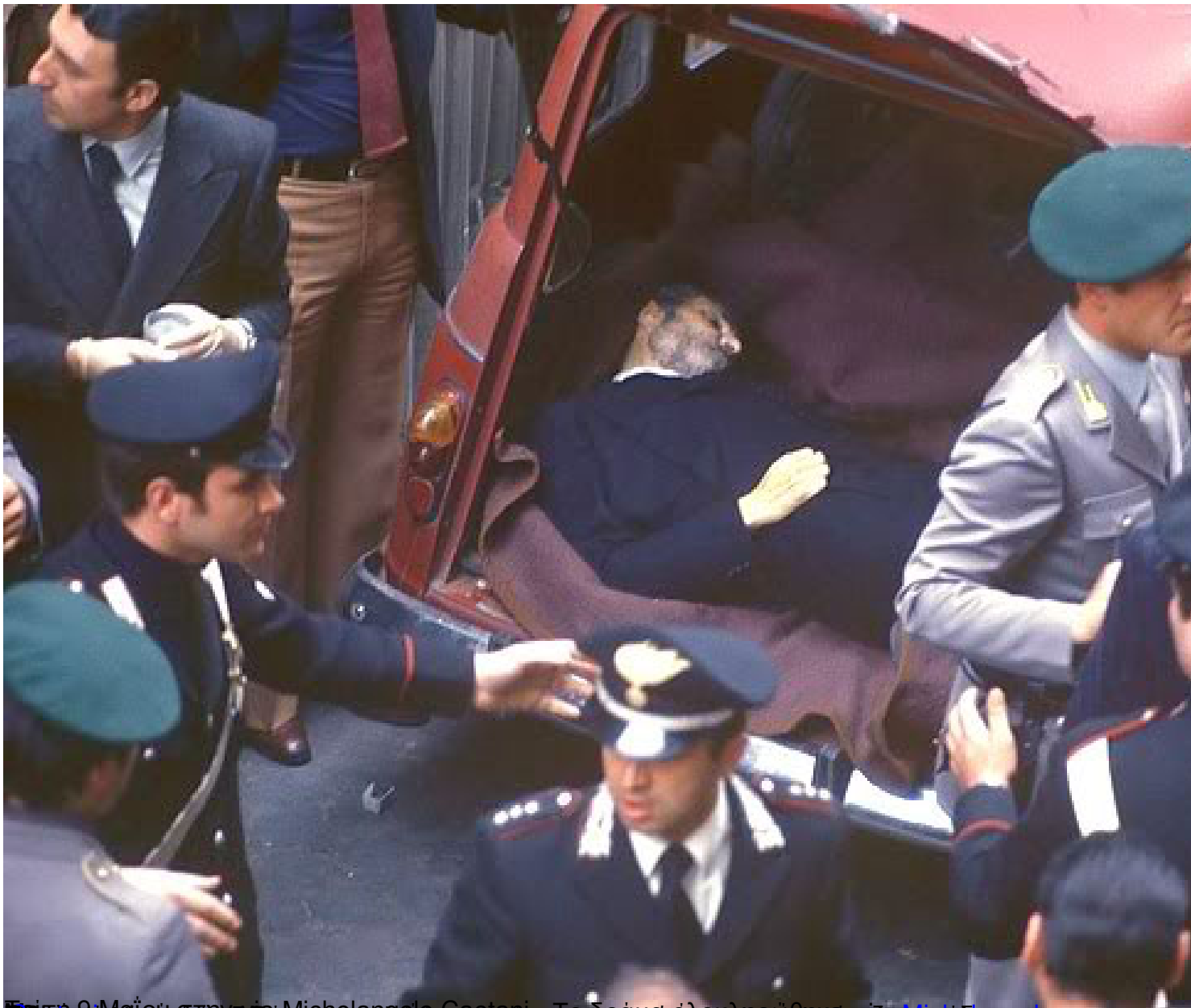
Σάββατο 9 Μαΐου 2015, στο σπίτι του Michelangelo. Ο φωτογράφος στέφανα κόντολαριόπουλο για τις Επίθεσεις στην Καθημερινή, 1975. Η φωτογραφία είναι από το βιβλίο του κόντολαριόπουλο Αλντό Μορο: Η ιστορία της απαγωγής