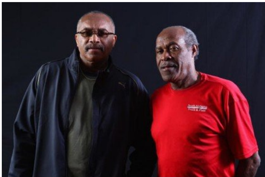
Επίθεση κατά των Ολυμπιακών Αγώνων, 1968