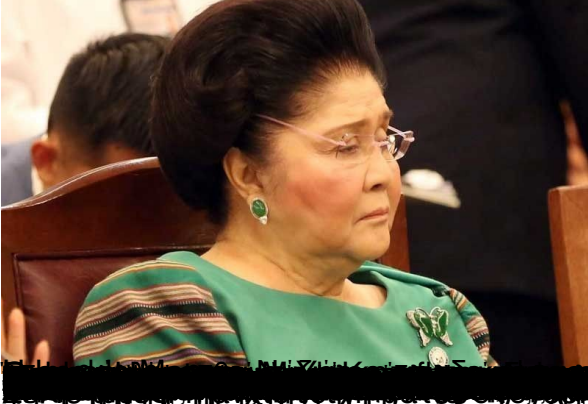
Αντιπροσωπευτικό φωτογραφικό υλικό από το βιβλίο "The Deal" του Φρέντσο, που διαβάζει ο Άν