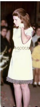
Αντιπροσωπευτικό φωτογραφικό υλικό από το βιβλίο "The Deal" του Φρέντσο, που διαβάζει ο Άν