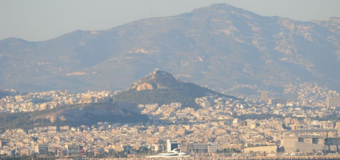
Πάρος, 2 Αυγούστου 2017, 10:15 π.μ. - Πάρος, 2 Αυγούστου 2017, 10:15 π.μ.