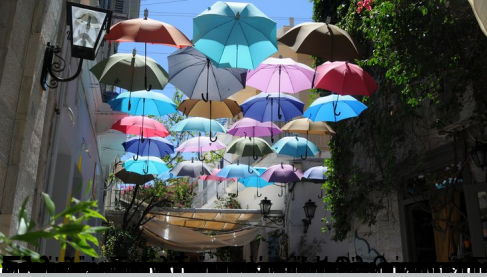
Πάρος, 2 Αυγούστου 2017, 10:15 π.μ. - Πάρος, 2 Αυγούστου 2017, 10:15 π.μ.