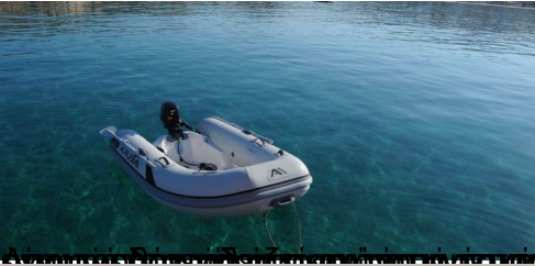
Χαλιβάκι, Πάρος, 2 Αυγούστου 2017, 10:15 π.μ. - Πάρος, 2 Αυγούστου 2017, 10:15 π.μ.