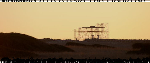
Πάρος, 2 Αυγούστου 2017, 10:15 π.μ. - Πάρος, 2 Αυγούστου 2017, 10:15 π.μ.