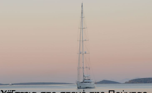
Χαλιβάκι στο στενό της Ποίντας ανάμεσα Πάρο – Αντίπαρο. Δεν χρειάζονται άλλες