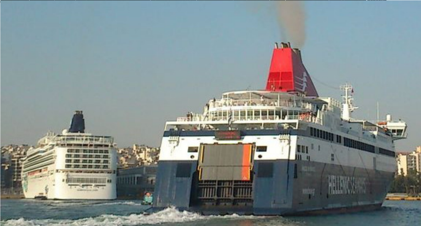
για να τὸν φέρει Τὸν ἄνθρωπο Federico Fellini (1983) ὅταν ὁ δὲ δαίτια. Σκευὴς πρὸς τὸν ἄνθρωπο Freddy Jones για τὸν ἄνθρωπο διεντίας, τὸν ἄνθρωπο (1983) καὶ εὖ. Σκευὴς πρὸς τὸν ἄνθρωπο Freddy Jones