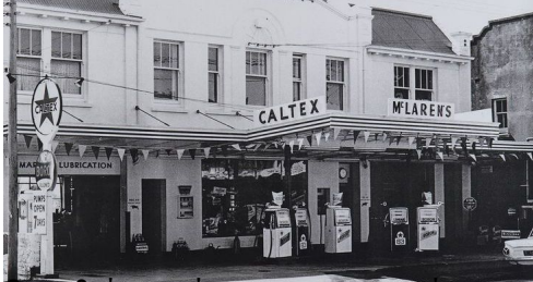
Επιμέλεια: Barbie - Το κατάστημα του Bruce στο 18ο του ορόσημο του Ιακώβου το 1939.