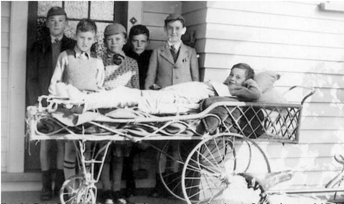
Επιμέλεια: Barbie - Bruce στο 18ο του ορόσημο του Ιακώβου το 1939. Τα παιδιά δεξιά γράφουν κείμενα σχετικά με την εργασία.