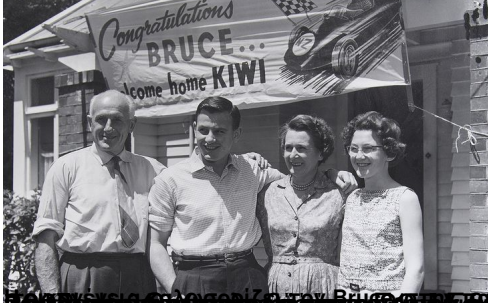
Επιμέλεια: Barbie - Ο Bruce επιστρέφει από την Αυστραλία το 1939.