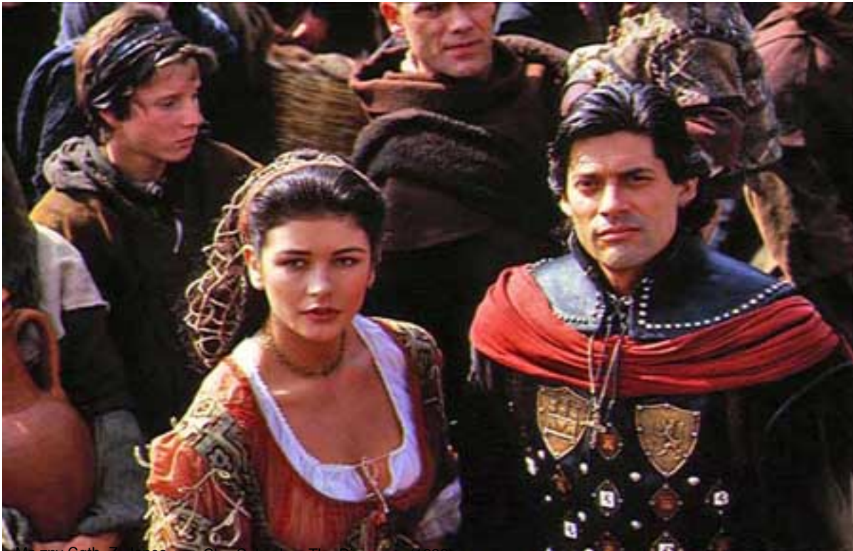
Jim Caviezel, Simer Elyse, 'The Discovery' (1992)