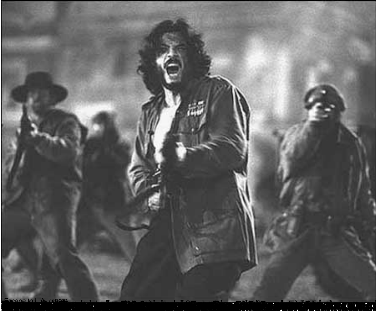
Escape to L.A. (1997) by John Dahl. "The album is a tribute to the music of the 1960s and 1970s, with a focus on soul and funk. It features a mix of orchestral and electronic sounds, and is a testament to Jackson's versatility as an artist." Διακρίσεις