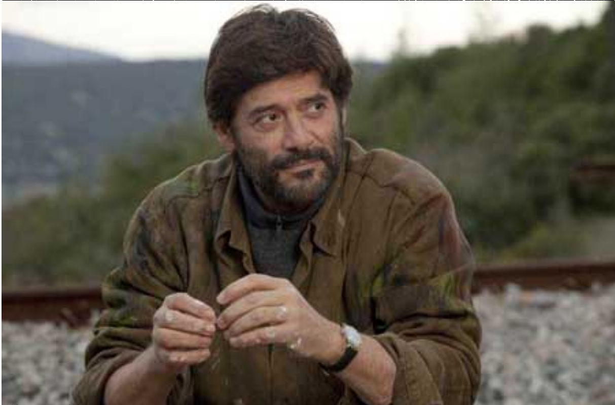
Ηταν ο πρώτος (2011) by Νίκος Χατζηνικολάου. "Ο πρώτος είναι ένα πορτρέτο ενός ανθρώπου που έχει περάσει από πολλές εμπειρίες και έχει μάθει να αντιμετωπίζει την ζωή με δύναμη και αξιοπρέπεια." Διακρίσεις