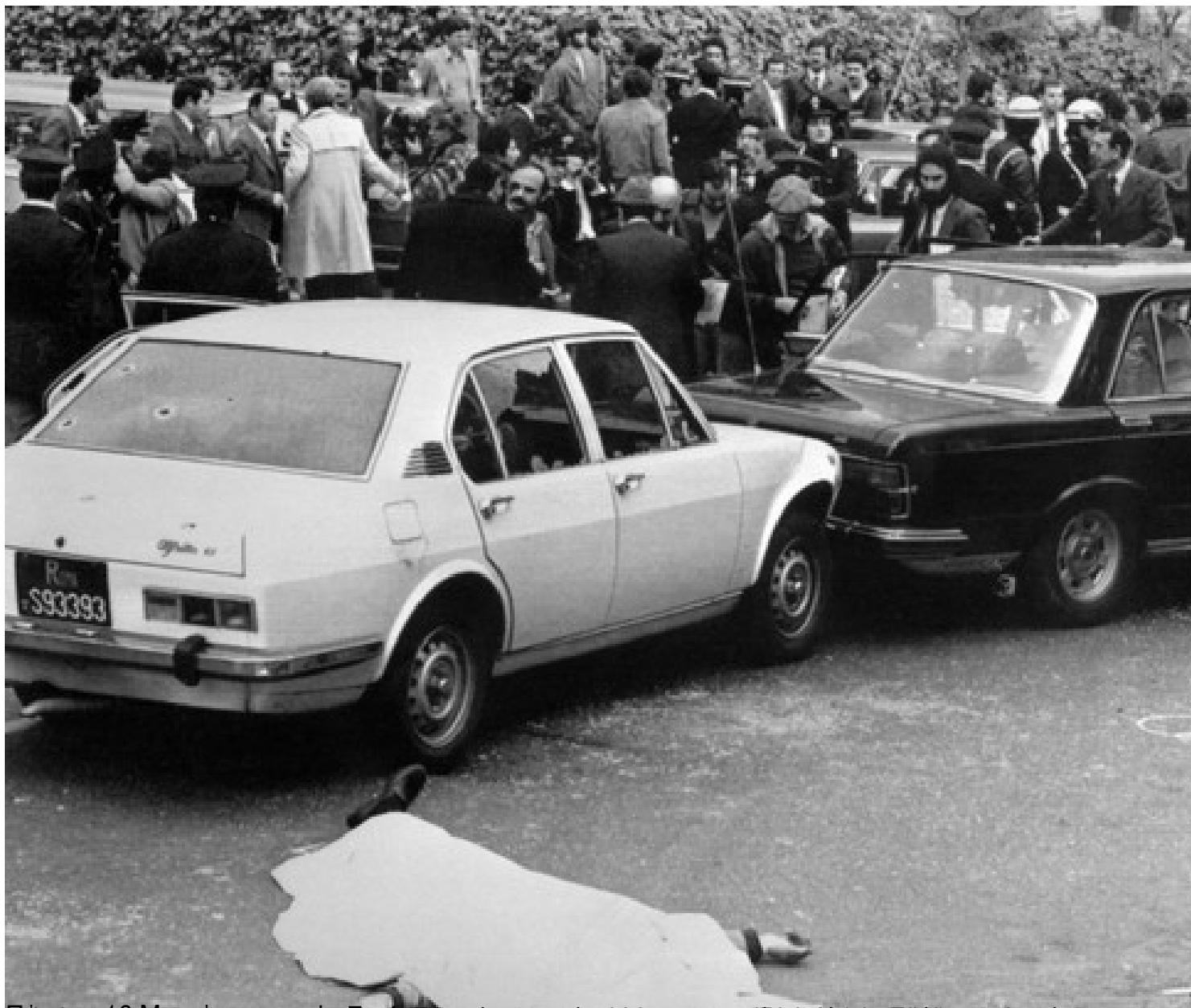
Επί της 6 Μαΐου 2015, στην Fani. Από τη Fani στην Fani και πολύ πιο μακριά - Σάββατο 9 Μαΐου 2015 (επανάρτηση)