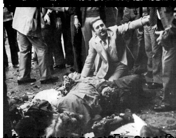
Επί της 6 Μαΐου 2015, στην Fani. Από τη Fani στην Fani και πολύ πιο μακριά - Σάββατο 9 Μαΐου 2015 (επανάρτηση)