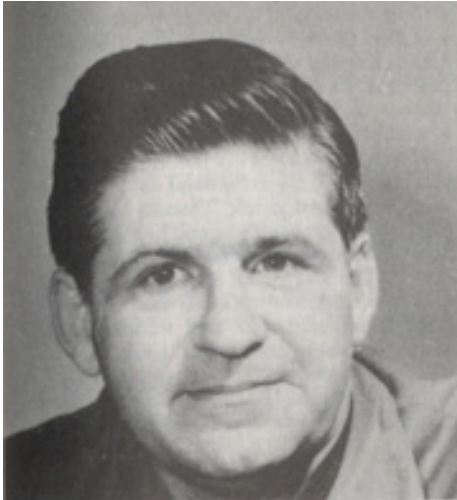
John Howard Griffin