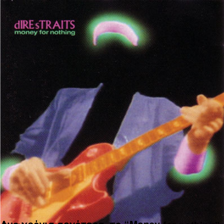
Από γρήγορα πωρότατο το "Money for Nothing" των Dire Straits έγινε το πρώτο βίντεο που έγινε χρυσό, πουλώνοντας 500.000 αντίτυπα.