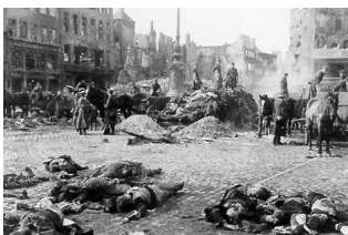
Guernica. Συλλογή νεκρών μετά τον βομβαρδισμό.

Κυριακή 26 Απριλίου 1937, στις 16: 30 ξεκίνησε το πρώτο κύμα βομβαρδισμών. Στο πέμπτο και τελευταίο, άφησαν πίσω τους ερείπια και εκατοντάδες νεκρούς. Πολίτες, γυναίκες, παιδιά. Για τον ακριβή αριθμό των θυμάτων ακόμα ερίζουν οι ιστορικοί. Ο Roux το χαρακτηρίζει ως: «...ένα πείραμα ανατομίας πάνω σε ζωντανά πλάσματα. Ένας μικρός πρόλογος των μελλοντικών τους ωμοτήτων.»