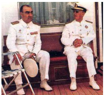
Luis Carrero Blanco & Francisco Franco

Πέρα από το τεράστιο πολιτικό αντίκτυπο που δημιούργησε σε παγκόσμιο επίπεδο, ενίσχυσε και το παραδοσιακό ποδοσφαιρικό μίσος ανάμεσα στην Ατλέτικ Μπιλμπάο και τη Ρεάλ Μαδρίτης.