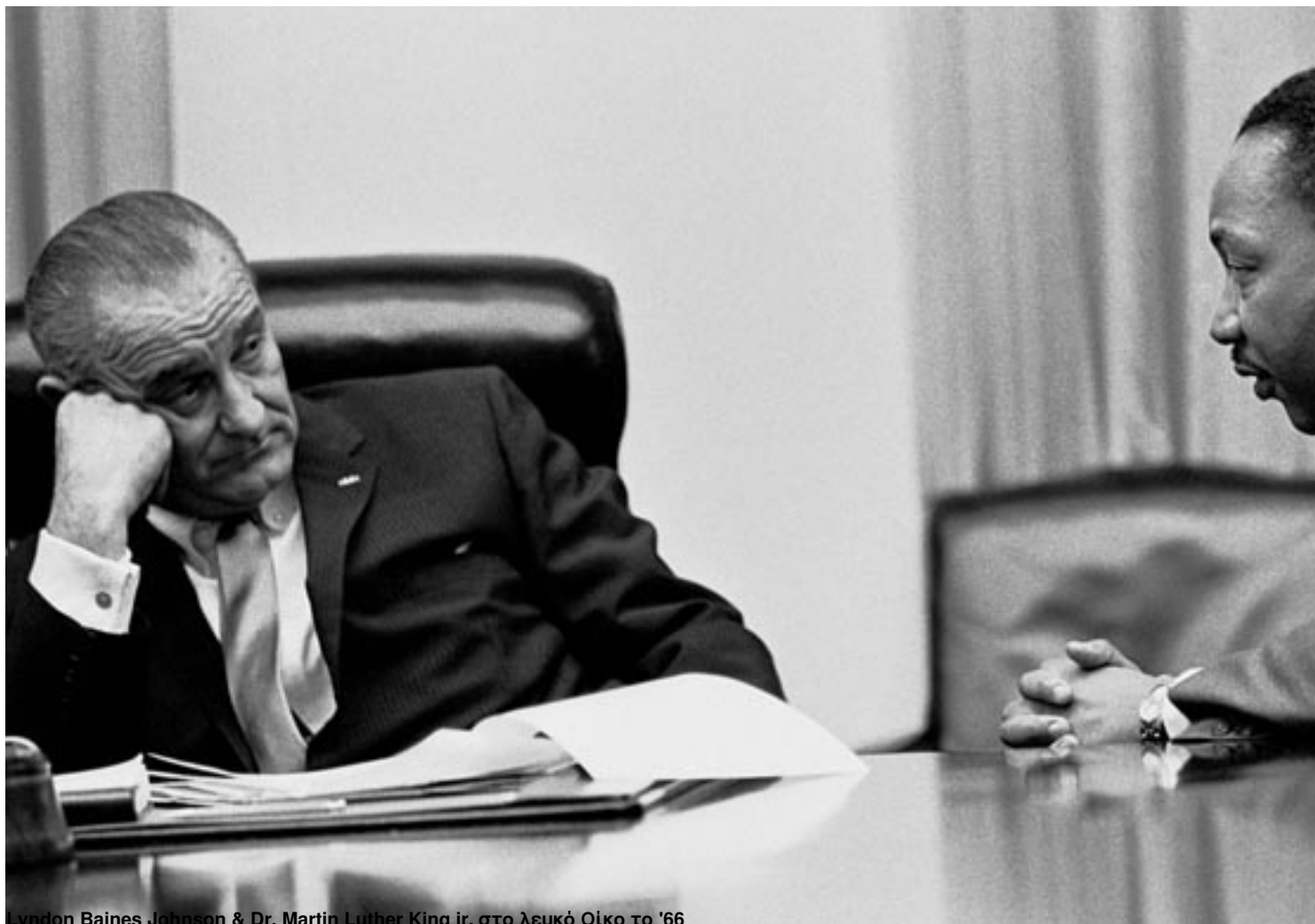
Lyndon Baines Johnson & Dr. Martin Luther King jr. στο λευκό Οίκο το '66