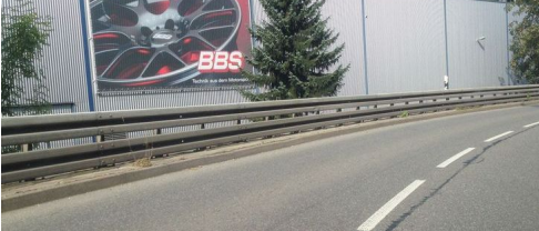
Κόκκινο BBS στο Μέλανο Δρυμό, στο Schiltach, μπροστά από το εμπρός αριστερό φτερό της κόκκινης Cayman S οι εγκαταστάσεις